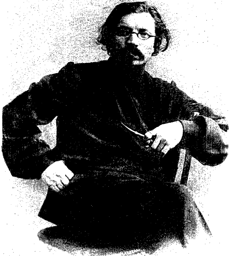
שלום-עליכם אין יאָהר 1905.